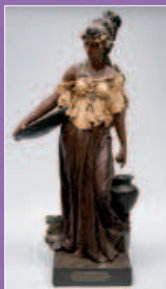
"La servante arabe" en plâtre polychromé. Probablement un travail autrichien. Époque: fin XIXe-début XXe s. H.: 92 cm.